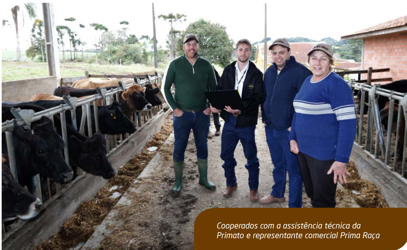
Cooperados com a assistência técnica da Primato e representante comercial Prima Raça