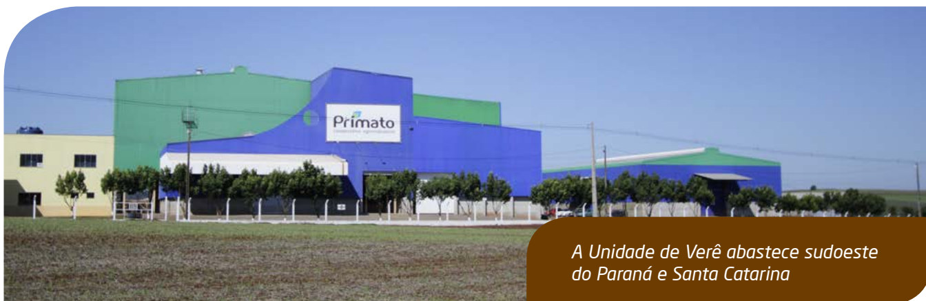
A Unidade de Verê abastece sudoeste do Paraná e Santa Catarina