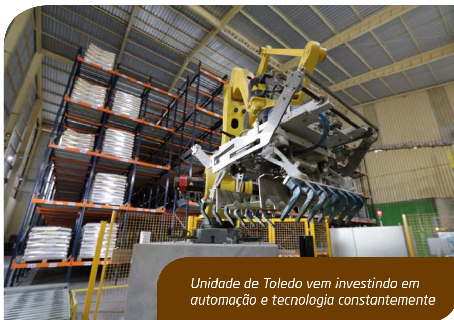
Unidade de Toledo vem investindo em automação e tecnologia constantemente

Para uma ração de qualidade, a seleção de matéria prima é primordial para que o padrão do produto seja uniforme. Para isso, o primeiro passo é a certificação dos fornecedores de farelo de soja, trigo e milho, além de premix e outros produtos utilizados na fabricação da ração. "Desde o início do processo temos um controle e certificação dos fornecedores antes de recebermos a matéria prima, fundamental para o controle de qualidade de nossas rações", explicou