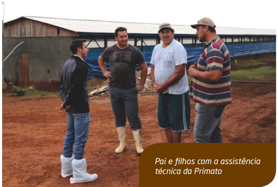
Pai e filhos com a assistência técnica da Primato

O cooperado enfatizou que nestes mais de dois anos que está em parceria com a Primato na integração da suinocultura, está sendo uma experiência muito positiva, principalmente na evo-